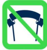
Banderoles : messages injurieux, politiques, idéologiques, philosophiques, publicitaires, racistes ou xénophobes