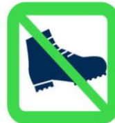
Chaussures de sécurité Safety Footwears