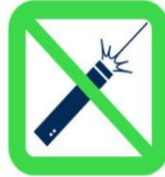
Pointeurs laser Laser Pointers