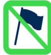
Hampes rigides, fagots de drapeaux Flagpoles