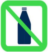
Bouteilles - Contenants à bouchon - Verres - Canettes - Bottles - Cork containers - Glasses - Cans