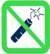
Articles pyrotechniques et matériels explosifs Pyrotechnics and explosive materials